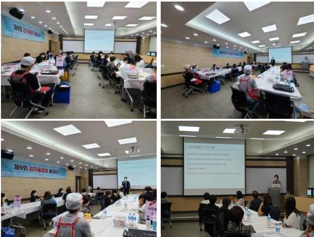
[그림 3-4] 관능평가 기준 패널 교육

* (예시) 테이블 1 패널 : A(각 5개 시료), B, C, D, E 순서로 평가 테이블 2 패널 : E, D, C, B, A 순서로 평가