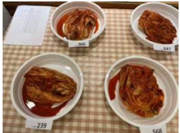
난수 표시된 김치시료