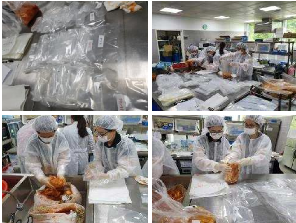
[그림 3-3] 평가시료 준비 및 이송