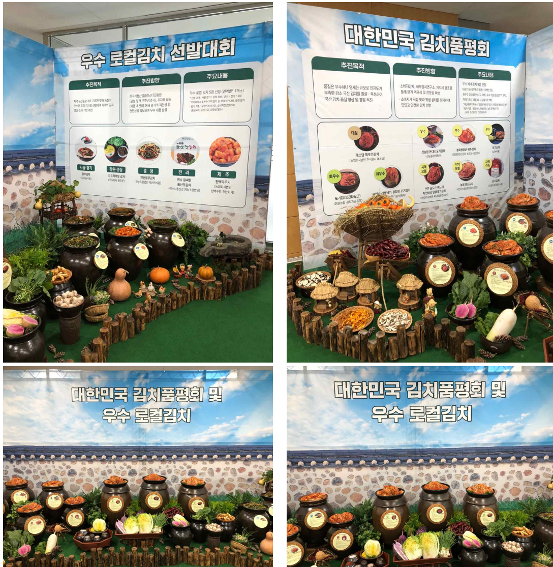
[그림 5-2] 부스 사진

다) '21년 제1회 우수 로컬김치 선발대회 입상 제품 전시 및 홍보(5점)