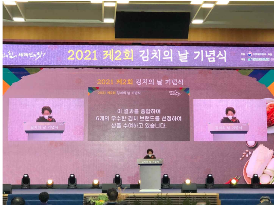
[그림 5-1] 시상식 사진