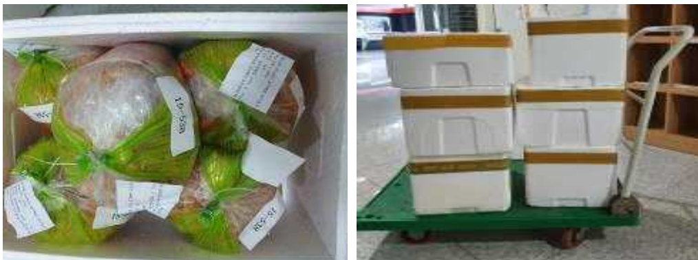
[그림 3-2] 평가시료 보관(세계김치연구소)