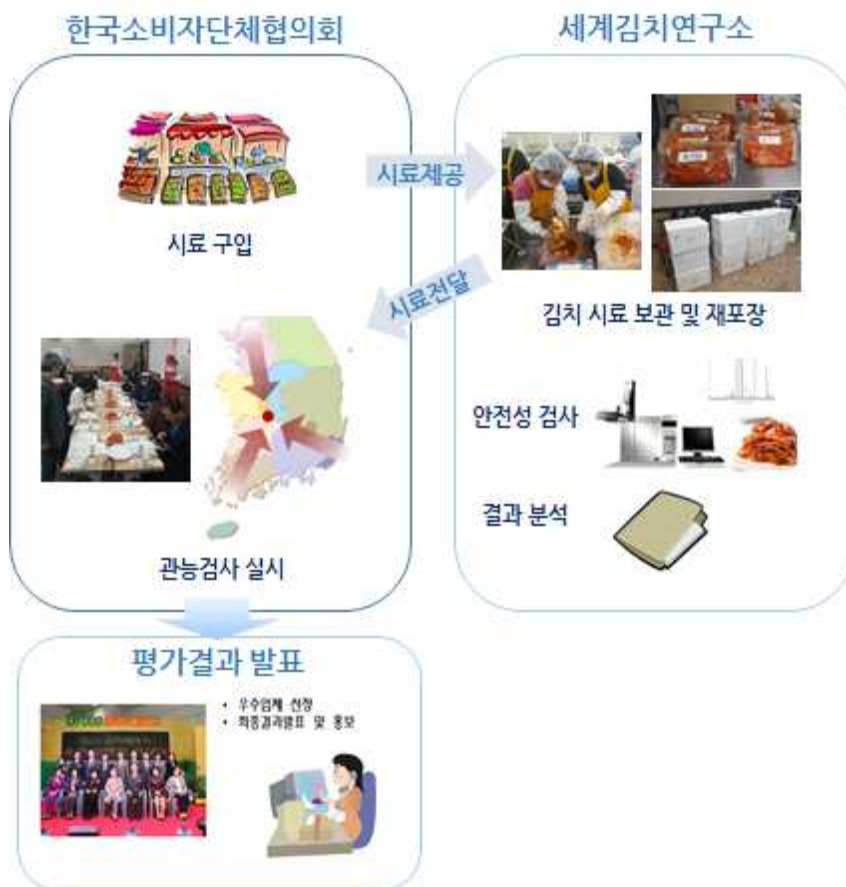
[그림 3-1] 김치품평회 추진체계